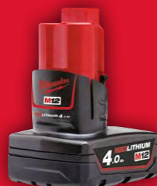
M12 B4 M12 BATERIA DE 4.0Ah REF. 4932430065 59,90€ SEM IVA