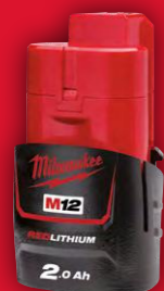
M12 B2 M12 BATERIA DE 2.0Ah REF. 4932430064 34,90€ SEM IVA