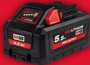
M18 HB5 M18 BATERIA DE 5.5Ah REF. 4932464712 149,90€ SEM IVA