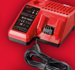
M12-18 AC M12 M18 CARREGADOR MULTI-VOLTAGEM PARA CARRO REF. 4932459205 99,90€ SEM IVA