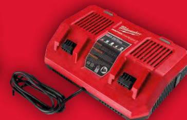
M18 DFC M18 CARREGADOR RÁPIDO DUPLO REF. 4932472073 149,90€ SEM IVA