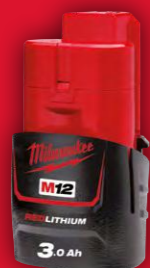
M12 B3 M12 BATERIA DE 3.0Ah REF. 4932451388 49,90€ SEM IVA