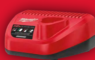
C12 C M12 CARREGADORES REF. 4932352000 39,90€ SEM IVA