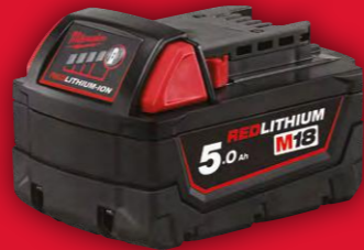
M18 B5 M18 BATERIA DE 5.0Ah REF. 4932430483 99,90€ SEM IVA