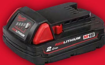
M18 B2 M18 BATERIA DE 2.0Ah REF. 4932430062 69,90€ SEM IVA