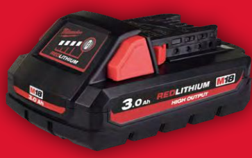
M18 HB3 M18 BATERIA DE 3.0Ah REF. 4932471069 79,90€ SEM IVA