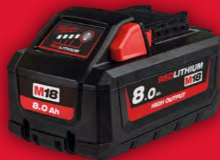
M18 HB8 M18 BATERIA DE 8.0Ah REF. 4932471070 179,90€ SEM IVA