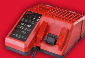
M12-18 C M12 M18 CARREGADOR MULTI-VOLTAGEM REF. 4932352959 69,90€ SEM IVA