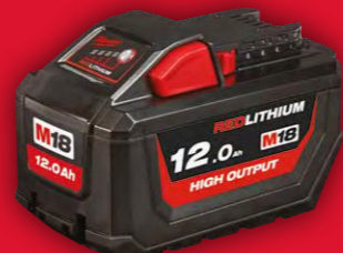
M18 HB12 M18 BATERIA DE 12.0Ah REF. 4932464260 249,90€ SEM IVA