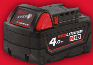
M18 B4 M18 BATERIA DE 4.0Ah REF. 4932430063 89,90€ SEM IVA