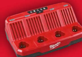
M12 C4 M12 CARREGADOR MÚLTIPLO REF. 4932430554 99,90€ SEM IVA