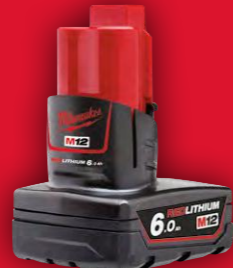
M12 B6 M12 BATERIA DE 6.0Ah REF. 4932451395 74,90€ SEM IVA