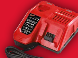
M12-18 FC M12 M18 CARREGADOR RÁPIDO MULTI-VOLTAGEM REF. 4932451079 89,90€ SEM IVA