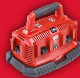
M1418 C6 M18 CARREGADOR MÚLTIPLO REF. 4932430086 119,90€ SEM IVA