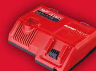
M12-18 SC M12 M18 CARREGADOR SUPER RÁPIDO MULTI-VOLTAGEM REF. 4932471736 169,90€ SEM IVA

KITS NRG DE BATERIAS E CARREGADORES DISPONÍVEIS